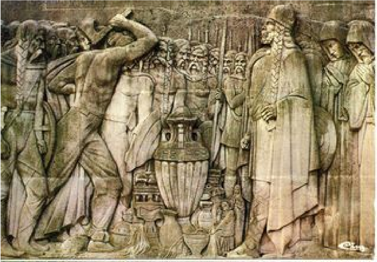
^ Représentation de la scène où un soldat franc brise le vase de Soissons devant Clovis.

Soissons fait partie intégrante de la royauté mérovingienne. Comme Clovis à Paris, son fils Clotaire élève à Soissons un mausolée royal, la future abbaye Saint Médard. Celle-ci devient un lieu de pèlerinage autour des sépultures de Médard, évêque de Noyonnet plus tard de Clotaire de Sigebert, fils et petit-fils de Clovis.