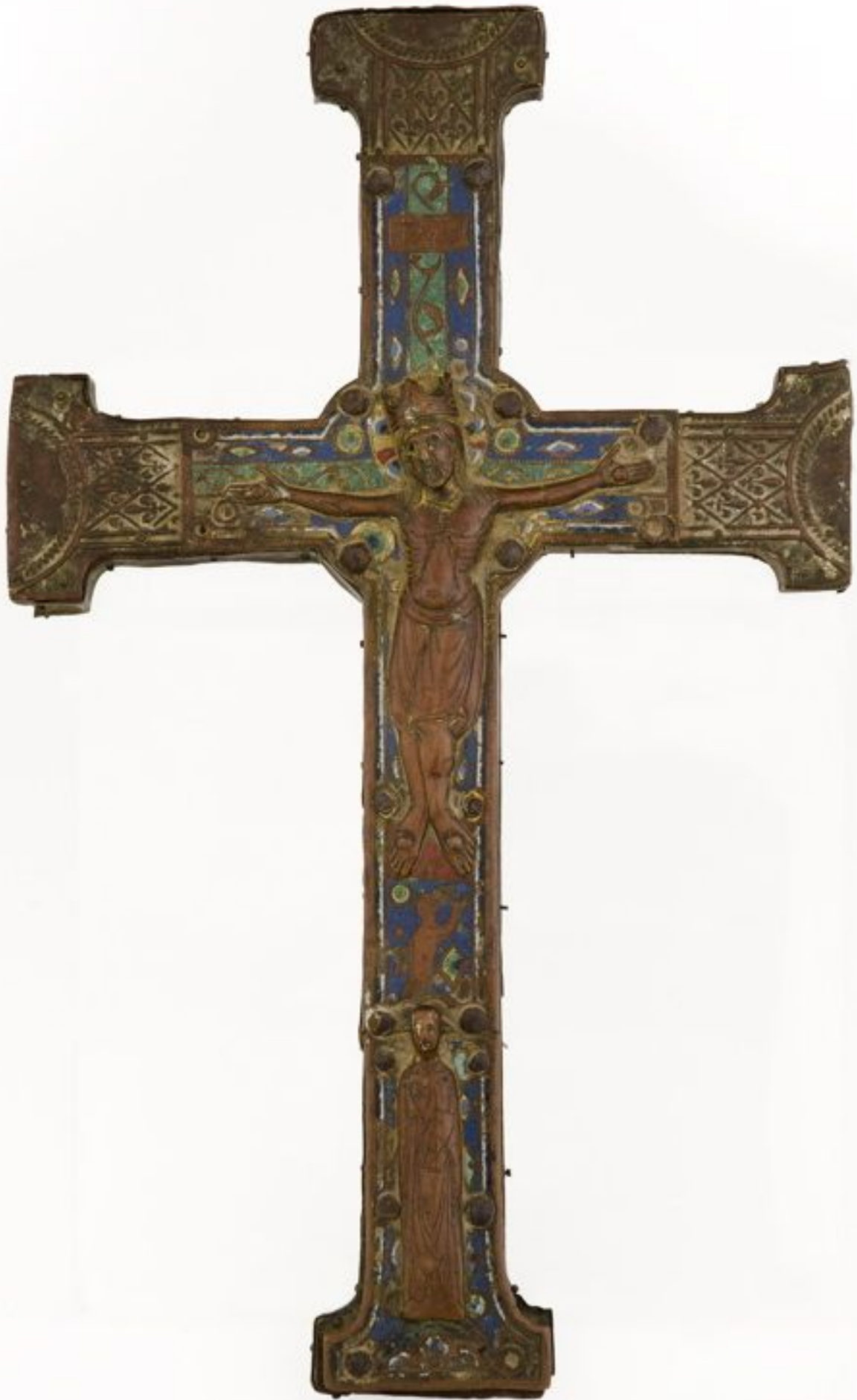
France, 1 er quart du 13 e siècle Émaux champlevés, cuivre, bois Inv. d.2005.0.4. Dépôt 1996,