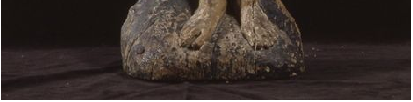
Bois polychrome Inv. 93.56.1. Achat 1887, musée de Soissons