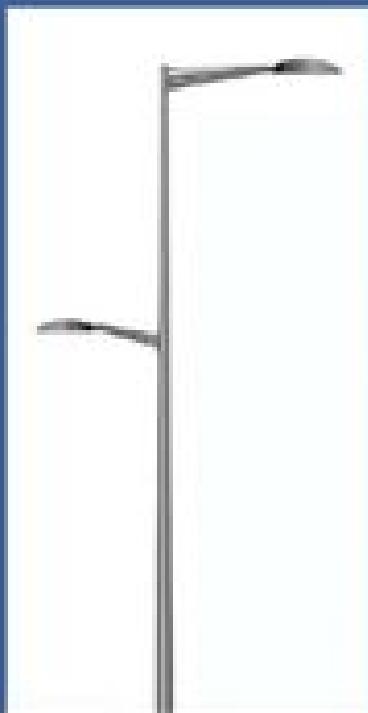
202 candélabres type routier