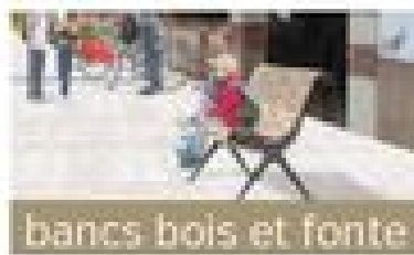
bancs bois et fonte