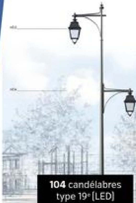
104 candélabres type 19 e [LED]