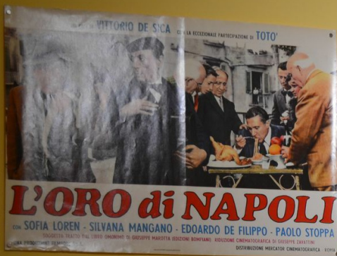
L'Or de Naples ( L'oro di Napoli , Vittorio de Sica - Italie, 1954)

Ce film à sketch appartient au genre de la comédie. Le premier épisode intitulé Il Guappo met en scène Don Saverio Petrillo (Totò) qui laisse depuis des années un caïd napolitain s'imposer chez lui au moment du repas. Se croyant mourant - une indigestion sera finalement diagnostiquée par le médecin - il décide de se rebeller. Outre deux natures mortes qui ornent le salon, faisant référence à la mise en scène picturale de la nourriture, le film rappelle certains tableaux du genre à travers les anguilles que notre homme porte dans la cuisine devant les enfants rieurs. Le plaisir de se retrouver entre soi est aussi visible le soir de Noël, que la famille célèbre autour de spaghetti et d'une bonne bouteille.