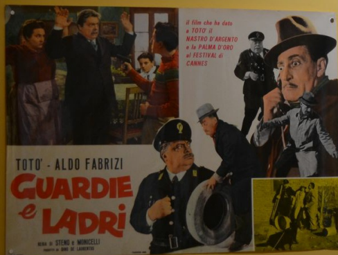
Gendarmes et Voleurs ( Guardie e ladri , Mario Monicelli et Steno - Italie, 1951)

Ce film choral à l'interprétation remarquable (Vittorio Gassman, Marcello Mastroianni, Totò, Claudia Cardinale) conte la progression d'un groupe de voleurs vers le coffre-fort du mont-de-piété qu'ils souhaitent cambrioler. Les voleurs s'introduisent dans l'appartement d'une voisine de l'immeuble qui a déplacé son mobilier, induisant les larrons en erreur: à deux pas du butin, les voleurs creusent un mur qui les conduit... à la cuisine! Ils en profitent pour se restaurer, piochant chacun à leur tour dans une caserole abandonnée. Le film se termine sur le gros titre d'un journal qui s'étonne de cette farce: «Les éternels inconnus entrent par effraction dans un appartement et volent des pâtes aux pois chiches». Cette célèbre comédie italienne à l'humour corrosif montre qu'à quelque chose malheur est bon... au sens propre comme au figuré.