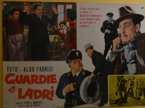
Gendarmes et Voleurs ( Guardie e ladri , Mario Monicelli et Steno - Italie, 1951)

Ce film choral à l'interprétation remarquable (Vittorio Gassman, Marcello Mastroianni, Totò, Claudia Cardinale) conte la progression d'un groupe de voleurs vers le coffre-fort du mont-de-piété qu'ils souhaitent cambrioler. Les voleurs s'introduisent dans l'appartement d'une voisine de l'immeuble qui a déplacé son mobilier, induisant les larrons en erreur: à deux pas du butin, les voleurs creusent un mur qui les conduit... à la cuisine! Ils en profitent pour se restaurer, piochant chacun à leur tour dans une caserole abandonnée. Le film se termine sur le gros titre d'un journal qui s'étonne de cette farce: «Les éternels inconnus entrent par effraction dans un appartement et volent des pâtes aux pois chiches». Cette célèbre comédie italienne à l'humour corrosif montre qu'à quelque chose malheur est bon... au sens propre comme au figuré.