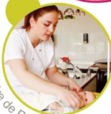
Auxiliaire de Puériculture