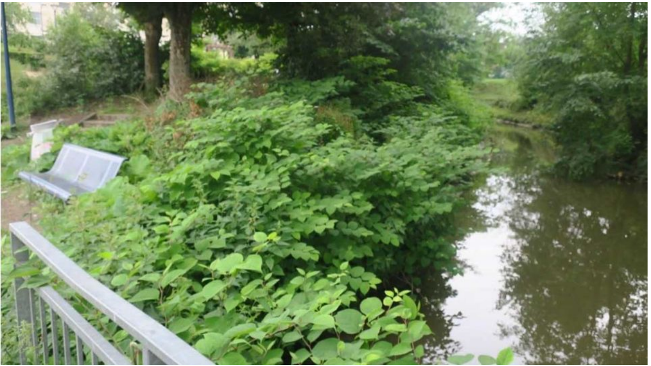
Vue de la Crise avant les travaux depuis la passerelle côté berges de l'Aisne. Nous apercevons la renouée du Japon qui "étouffe" la rivière.