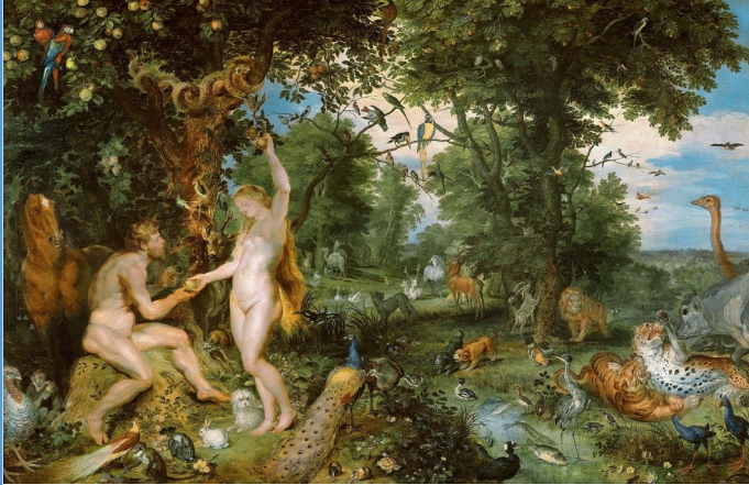
Pourquoi Adam et Ève ont été chassés du jardin d'Eden | National Geographic

« Au commencement , Dieu créa le ciel et la terre » (Genèse, 1 : 1)