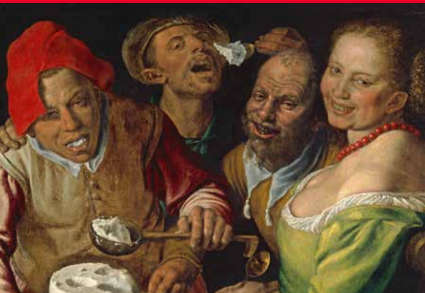
Les mangeurs de Ricotta, Vincenzo Campi, vers 1580

François Rabelais, Gargantua, I, 5, 1534