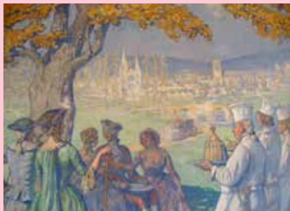
La collation, Lucien Jonas, 1928