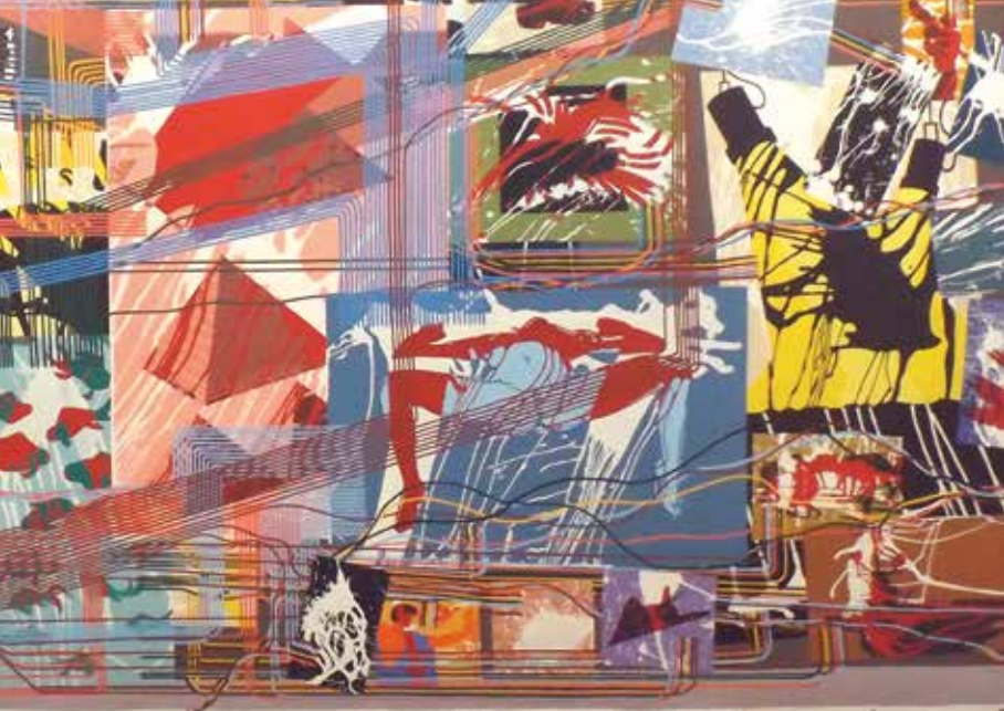
De toutes les couleurs, peinture d'histoire (Quadrichromie), 1991-1992, Paris, Centre National des Arts Plastiques, FNAC 02-663

dans la France de l'après-guerre. Acteur majeur du mouvement de la Figuration narrative, la photographie occupe une place déterminante dans son processus de création. Cette identité passe, chez Fromanger, par une utilisation savante de la couleur qui nourrit une démarche développée dans plus de trente-cinq séries, produites entre les années soixante et nos jours.