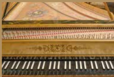
Clavecin, vers 1970-1991, coll. particulière

20 avril – 31 mai 2018 (vend-sam-dim. 14-18h)